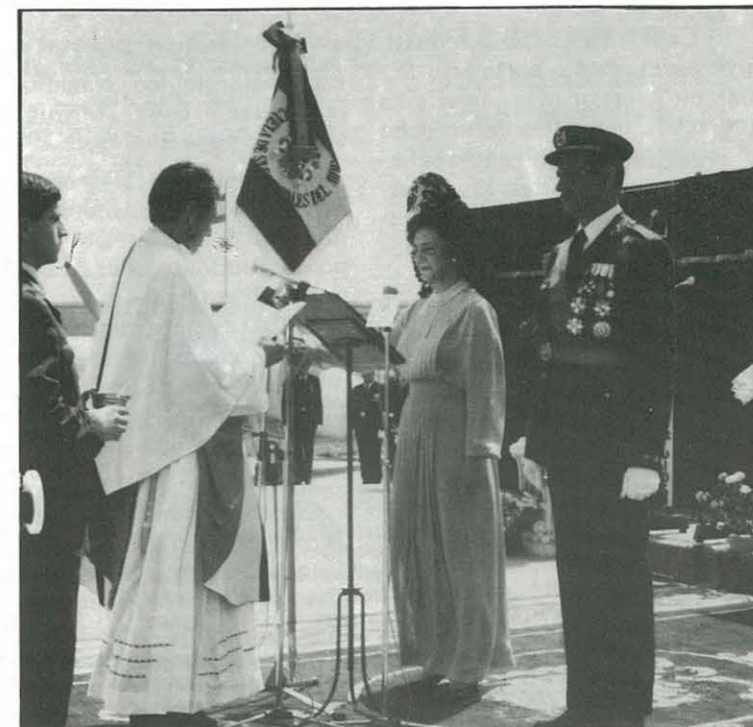
Momento solemne de la bendición del estandarte

ción para el gran número de veteranos que se dieron cita en la base de Reus, fuera el paso ante la nueva bandera, uno por uno, para renovar así su juramento de fidelidad. Lágrimas apenas contenidas y semblantes rígidos por la emoción, abundaron en ese instante.