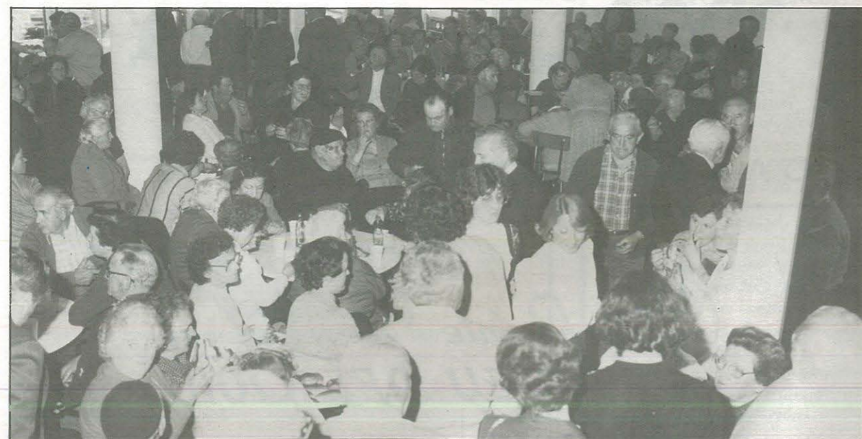
Massiva assistència de públic en el memorable acte inaugural

Lamentablemente siguen paralizadas las “grandes” obras de la Casa de la Cultura de la Villa, ubicada en la antigua Iglesia del Mercado Viejo. Esto no es lo malo, sino que lo peor fue la cesión gratuita que el Ayuntamiento socialista, con la colaboración incondicional de los cuatro adláteres ucedistas, culpables del nefasto “cambio” local, regalaron a la Diputación Provincial el inmueble y los terrenos valorados en millones de pesetas, sin compensación ni garantías. Se ha dicho que su construcción consta de dos fases, pero entre fase y fase no es posible admitir que sea necesario un espacio de tiempo tan dilatado y pernicioso. La desconfianza y la crítica popular está en la calle y ya se comenta que en la Villa se está construyendo otra famosa “Sagrada Familia”.