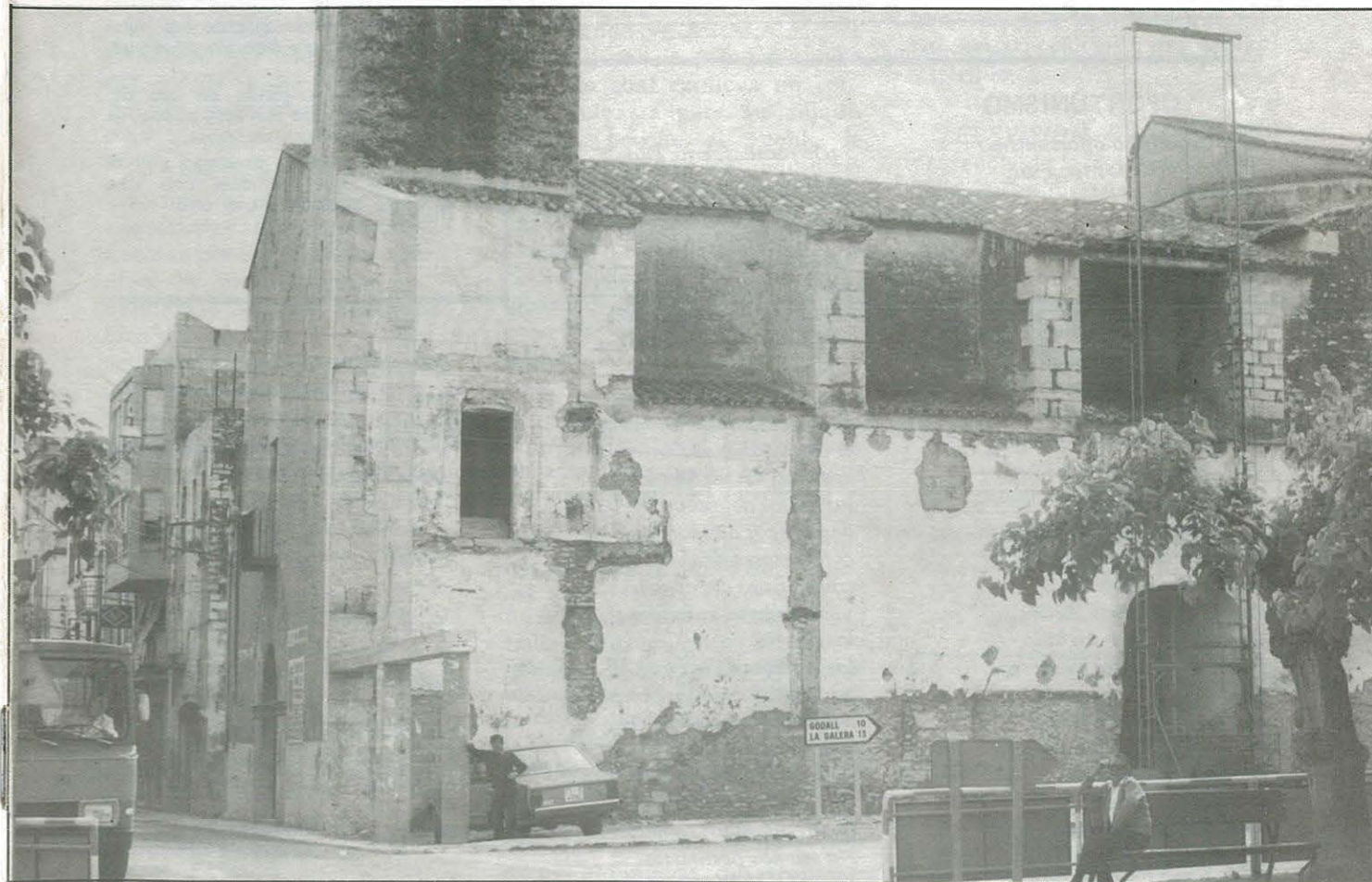
Estado deplorable de las obras de la Casa de la Cultura

Lamentablemente siguen paralizadas las “grandes” obras de la Casa de la Cultura de la Villa, ubicada en la antigua Iglesia del Mercado Viejo. Esto no es lo malo, sino que lo peor fue la cesión gratuita que el Ayuntamiento socialista, con la colaboración incondicional de los cuatro adláteres ucedistas, culpables del nefasto “cambio” local, regalaron a la Diputación Provincial el inmueble y los terrenos valorados en millones de pesetas, sin compensación ni garantías. Se ha dicho que su construcción consta de dos fases, pero entre fase y fase no es posible admitir que sea necesario un espacio de tiempo tan dilatado y pernicioso. La desconfianza y la crítica popular está en la calle y ya se comenta que en la Villa se está construyendo otra famosa “Sagrada Familia”.